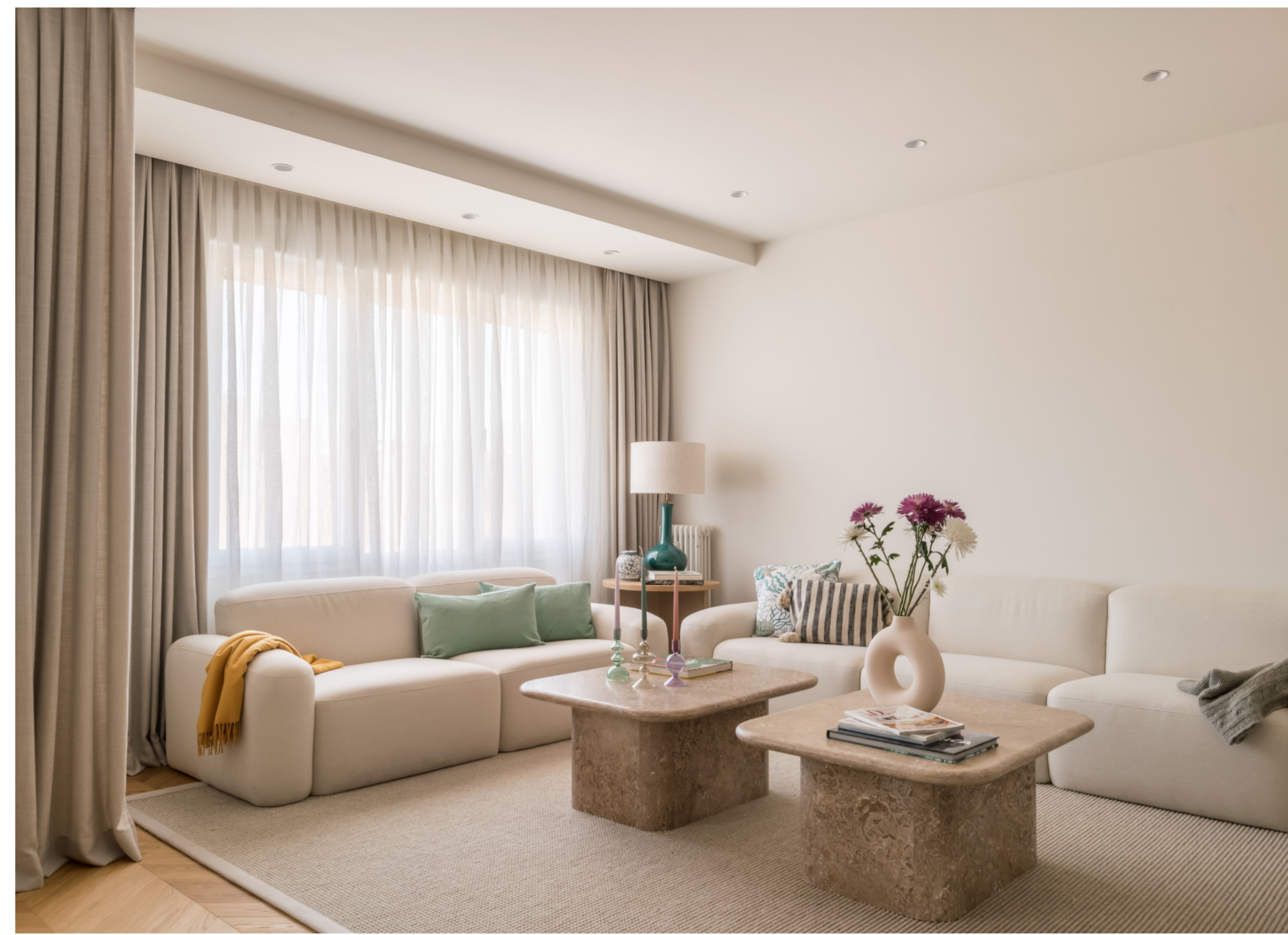
En esta página: salón y comedor. En la página siguiente; arriba: zona de sofás. Abajo: mesa de comedor.