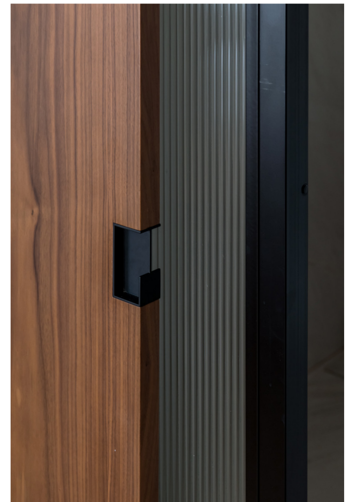
En esta página; arriba: dormitorio principal, entrada al baño en suite. Abajo: aseo de invitados oculto en caja de nogal. Derecha: detalle tirador de corredera baños. En la página anterior; arriba: dormitorio ppal. Abajo: baños.